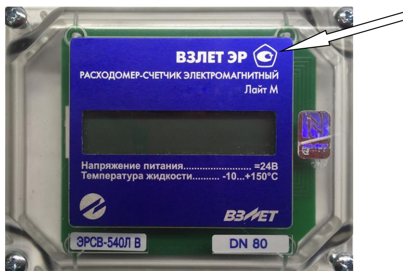
Рисунок 4 – Место нанесения знака утверждения типа

наносится на лицевую панель расходомеров методами шелкографии, термопечати, лазерной гравировки и/или металлографии, а также в центре титульных листов руководства по эксплуатации и паспорта типографским способом. Обозначение места нанесения знака утверждения типа представлено на рисунке 4.