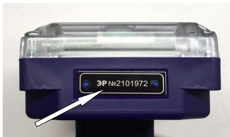
Рисунок 3 – Обозначение места нанесения заводского номера

Заводской номер расходомера наносится на маркировочную табличку, закрепленную на боковую панель расходомеров, методом шелкографии, термопечати, лазерной гравировки и/или металлографии. Обозначение места нанесения заводского номера представлено на рисунке 3.