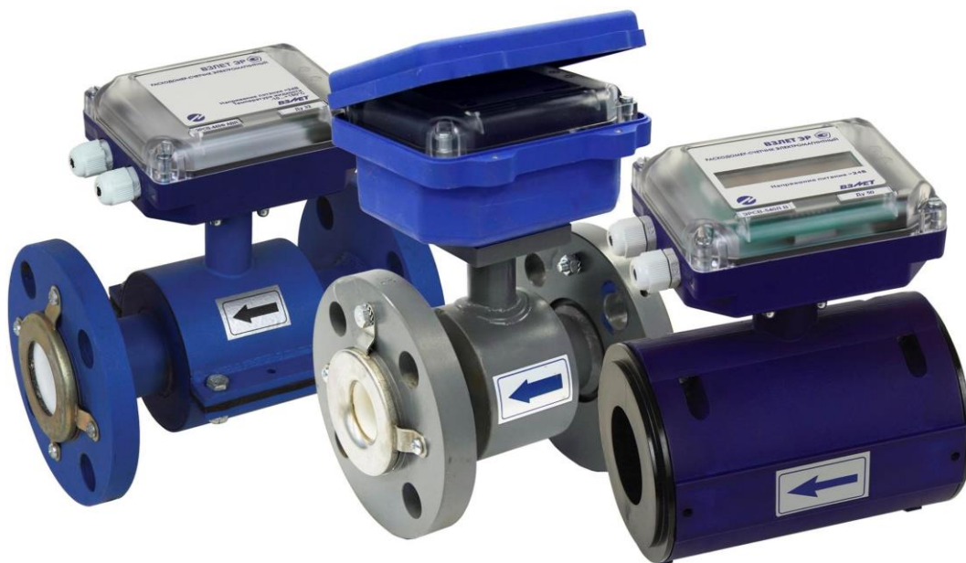
Рисунок 1 – Общий вид расходомеров

Общий вид расходомеров представлен на рисунке 1.