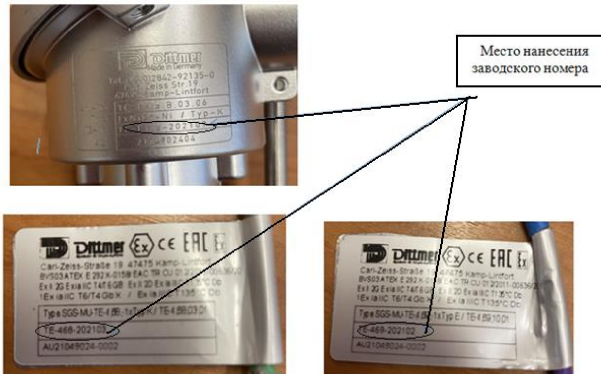
Рисунок 2 – Место нанесения заводского номера

Пломбирование термопреобразователей не предусмотрено.