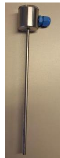
Модификация ТЕ-Ех1а,В(Ж, D, V),**,**