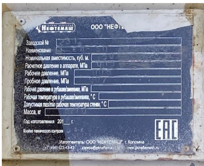
Рисунок 3 – Заводской номер резервуара .

Пломбирование резервуара не предусмотрено.