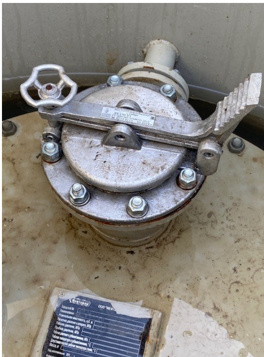
Рисунок 2 – Горловины и замерный люк резервуара.

Горловины и замерные люки резервуара стального горизонтального цилиндрического РГС-50 представлены на рисунке 2.