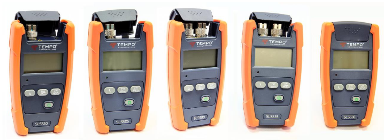
Рисунок 2 – Общий вид источников оптического излучения серии SLS