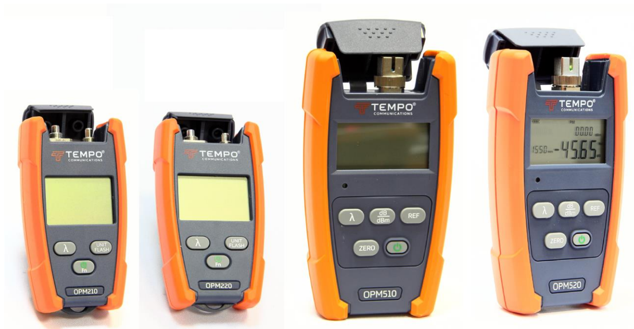
Рисунок 1 – Общий вид измерителей оптической мощности серии OPM

Заводской номер наносится в виде наклейки (для серий SLS500, OPM500 - на заднюю панель корпуса; для серии OPM200 – на внутреннюю поверхность батарейного отсека тестера).