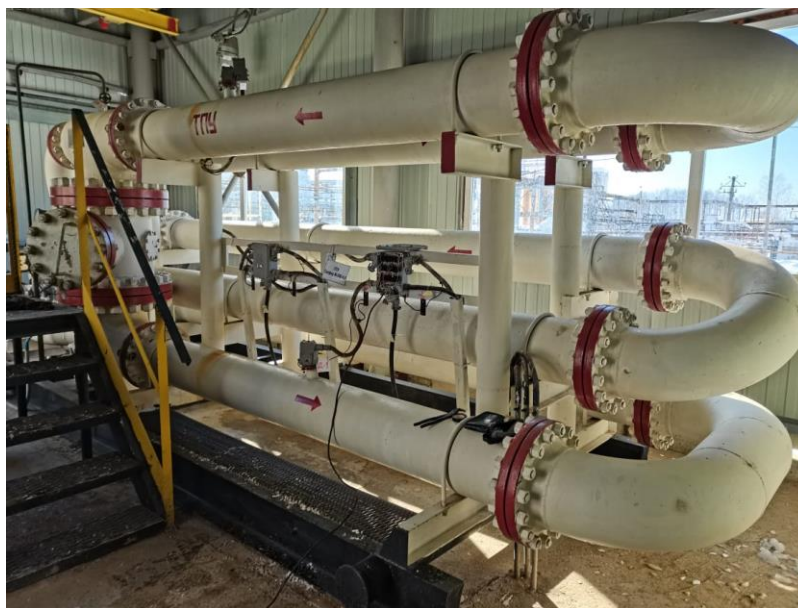
Рисунок 1 – Общий вид ТПУ

Установка пломб на ТПУ осуществляется с помощью контровочной проволоки и свинцовой (пластмассовой) пломбы с нанесением знака поверки давлением на пломбы, установленные: