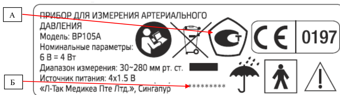
Рисунок 2 – Место нанесения знака утверждения типа (А) и заводского номера (Б)