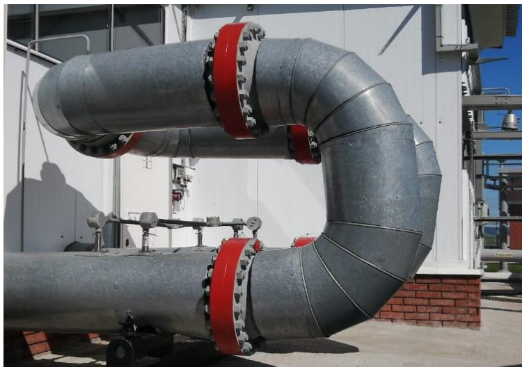
Рисунок 1 – Общий вид ТПУ

Установка пломб на ТПУ осуществляется с помощью проволоки и свинцовых (пластмассовых) пломб с нанесением знака поверки давлением на пломбы, установленные на контрольных проволоках, пропущенных через отверстия завернутых винтов крепления сигнализаторов прохождения шарового поршня, а также через отверстия в двух шпильках, расположенных диаметрально противоположно на всех присоединительных фланцах калиброванного участка.