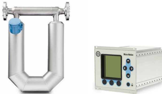
Рисунок 1 – Общий вид счетчика-расходомера

Общий вид счетчика-расходомера представлен на рисунке 1.