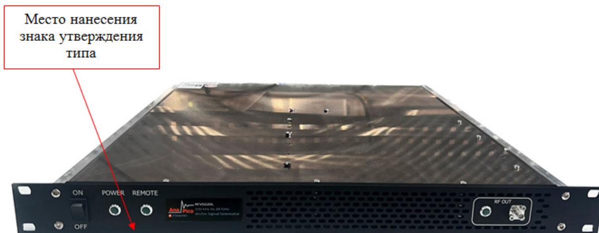
Рисунок 1 - Общий вид генераторов.