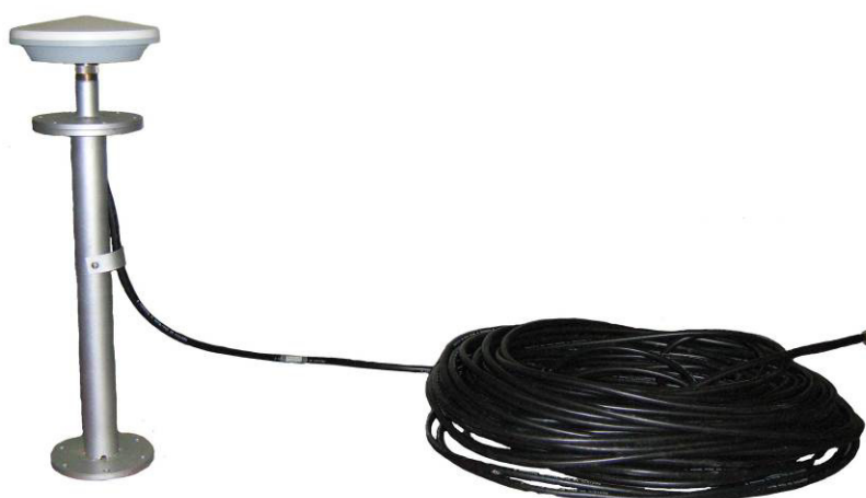
в) комплект антенный