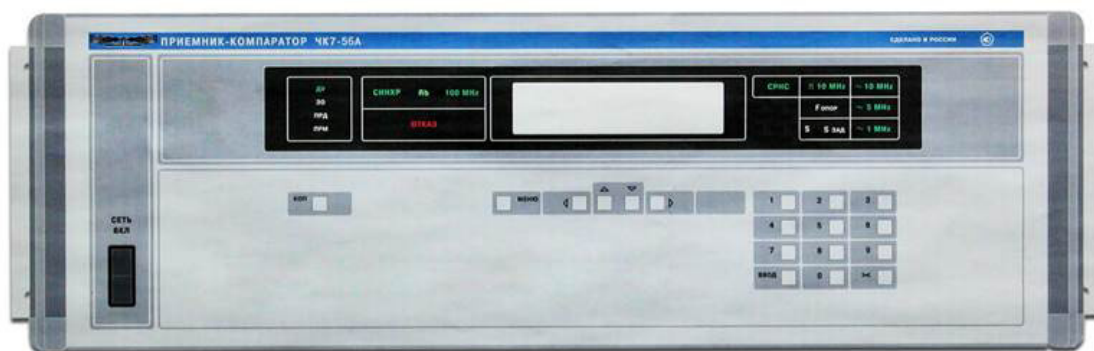
а) вид передней панели;