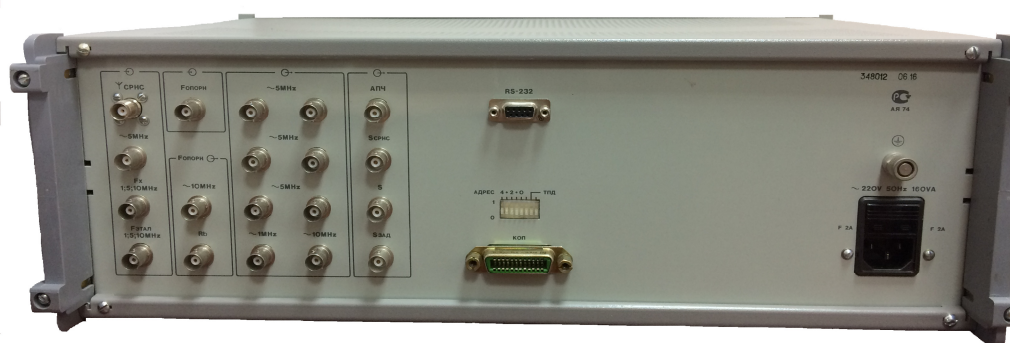
б) вид задней панели;