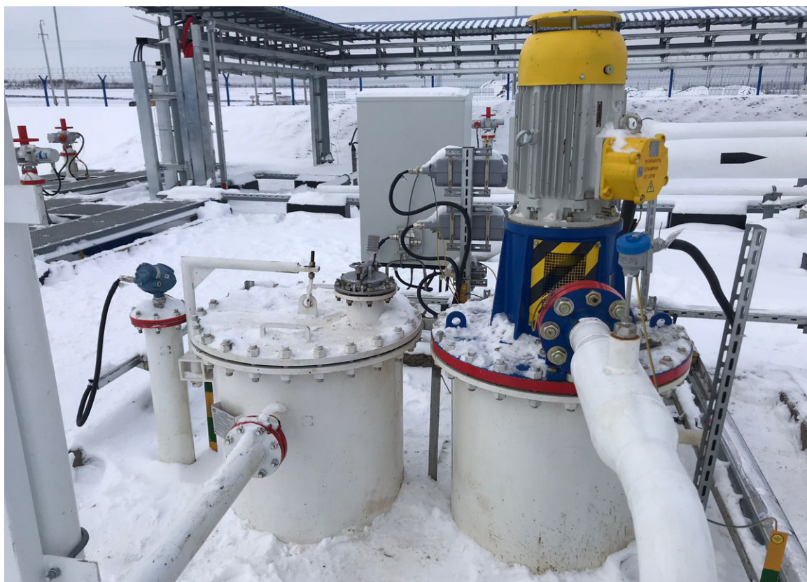
Рисунок 2 – Общий вид резервуара ЕП-5-1600-1500-А-СО-У1