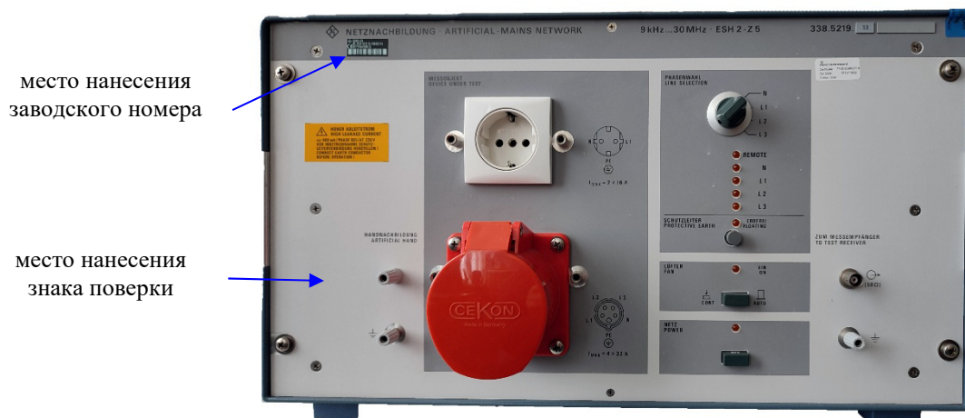
Рисунок 1 – Внешний вид эквивалента сети (вид спереди)