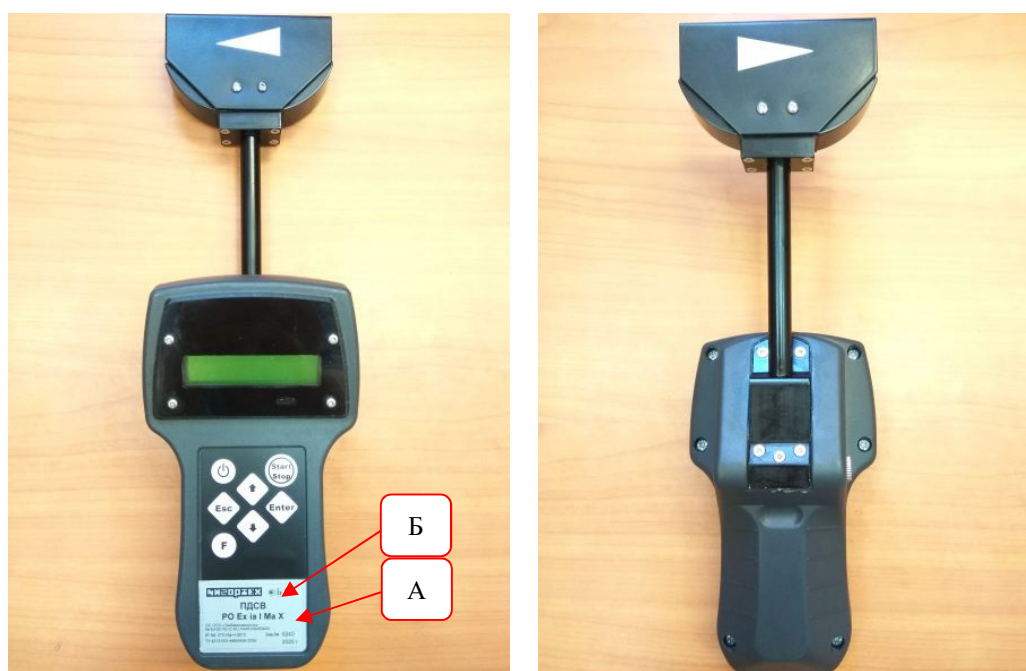
Рисунок 2 – Общий вид измерителя с встроенной головкой в корпусе тип 2; А – место нанесения заводского номера; Б – нанесения знака утверждения типа