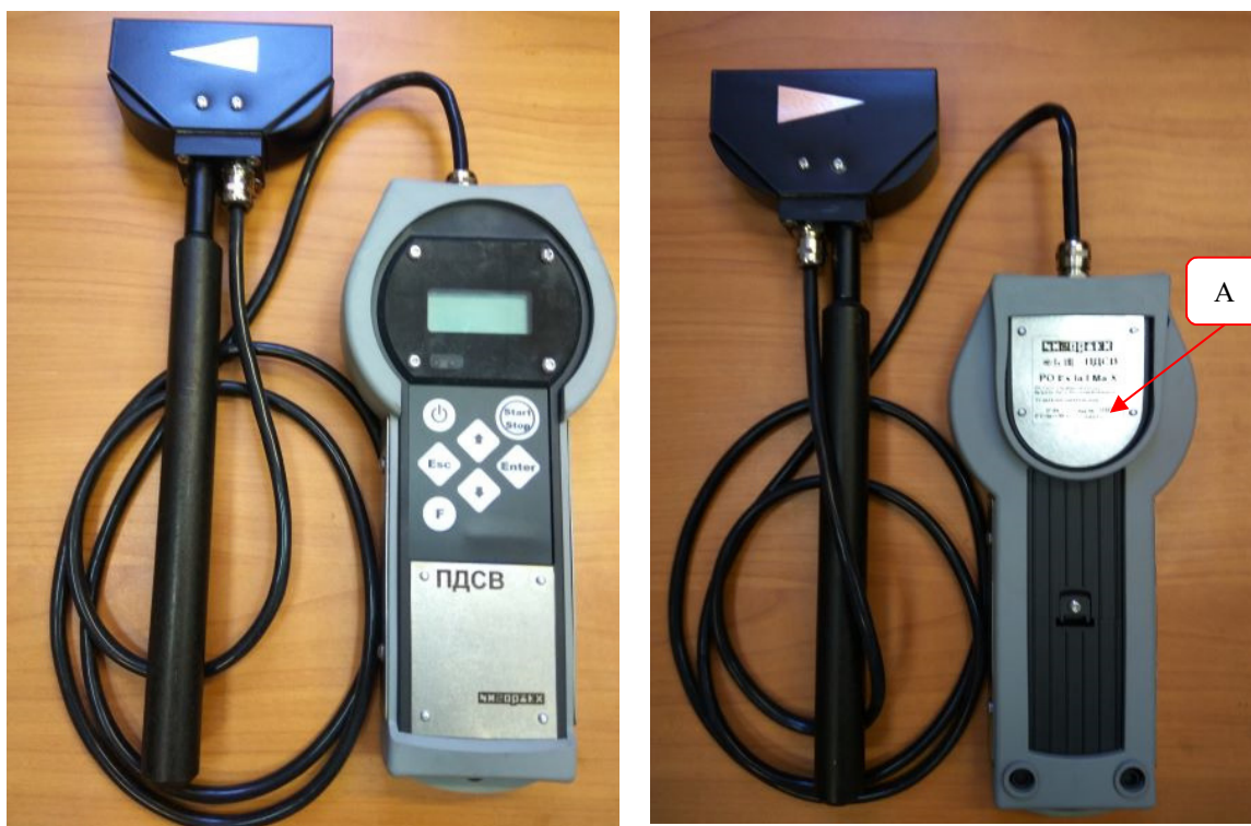
Рисунок 3 – Общий вид измерителя с выносной головкой в корпусе тип 1; А – место нанесения заводского номера