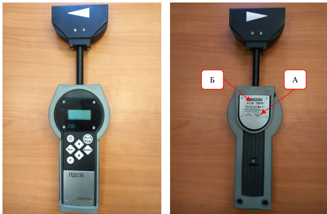
Рисунок 1 – Общий вид измерителя с встроенной головкой в корпусе тип 1; А – место нанесения заводского номера; Б – нанесения знака утверждения типа

Общий вид измерителей, а также места нанесения серийных номеров и знака поверки представлены на рисунках 1-3.