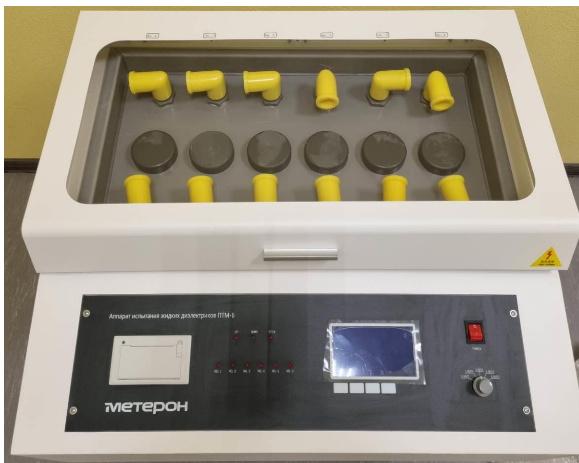
Рисунок 5 – Общий вид аппаратов испытания жидких диэлектриков Метерон ПТМ-6