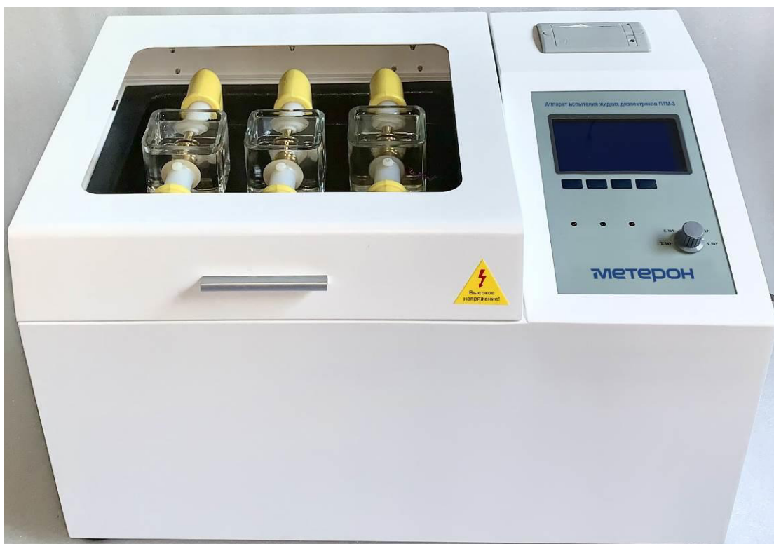
Рисунок 4 – Общий вид аппаратов испытания жидких диэлектриков Метерон ПТМ-3