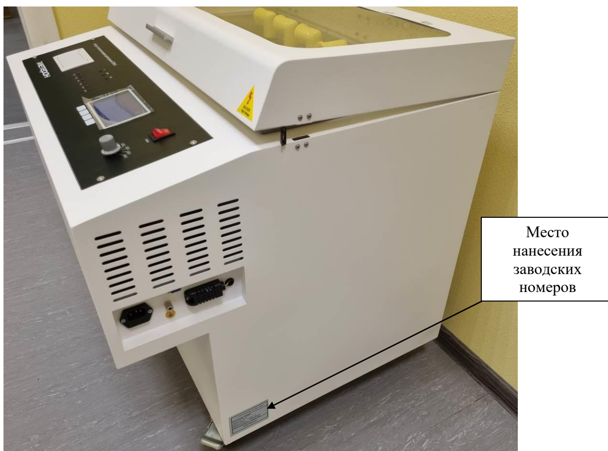
Рисунок 7 – Обозначение места нанесения заводских номеров