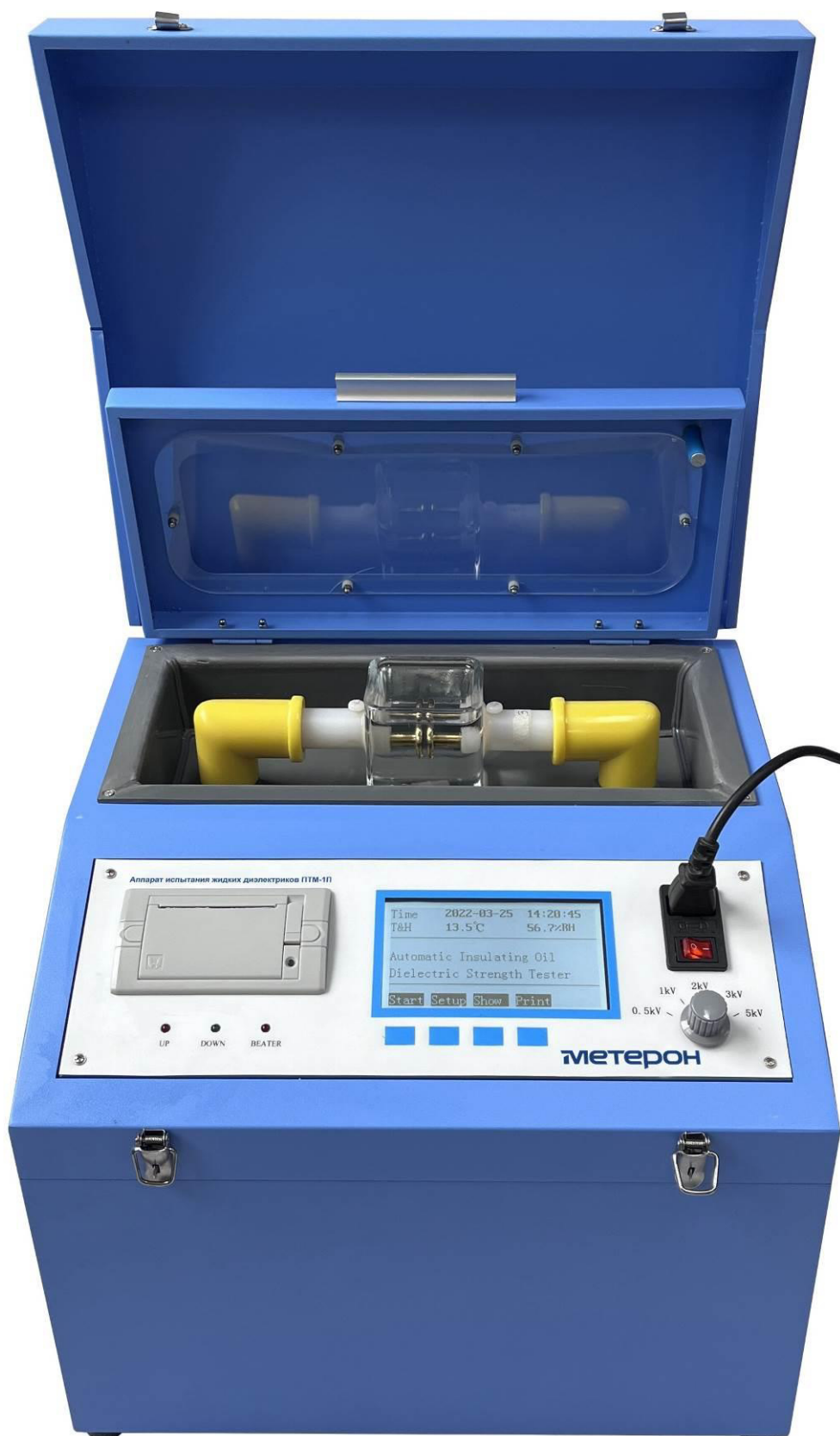
Рисунок 3 – Общий вид аппаратов испытания жидких диэлектриков Метерон ПТМ-1П