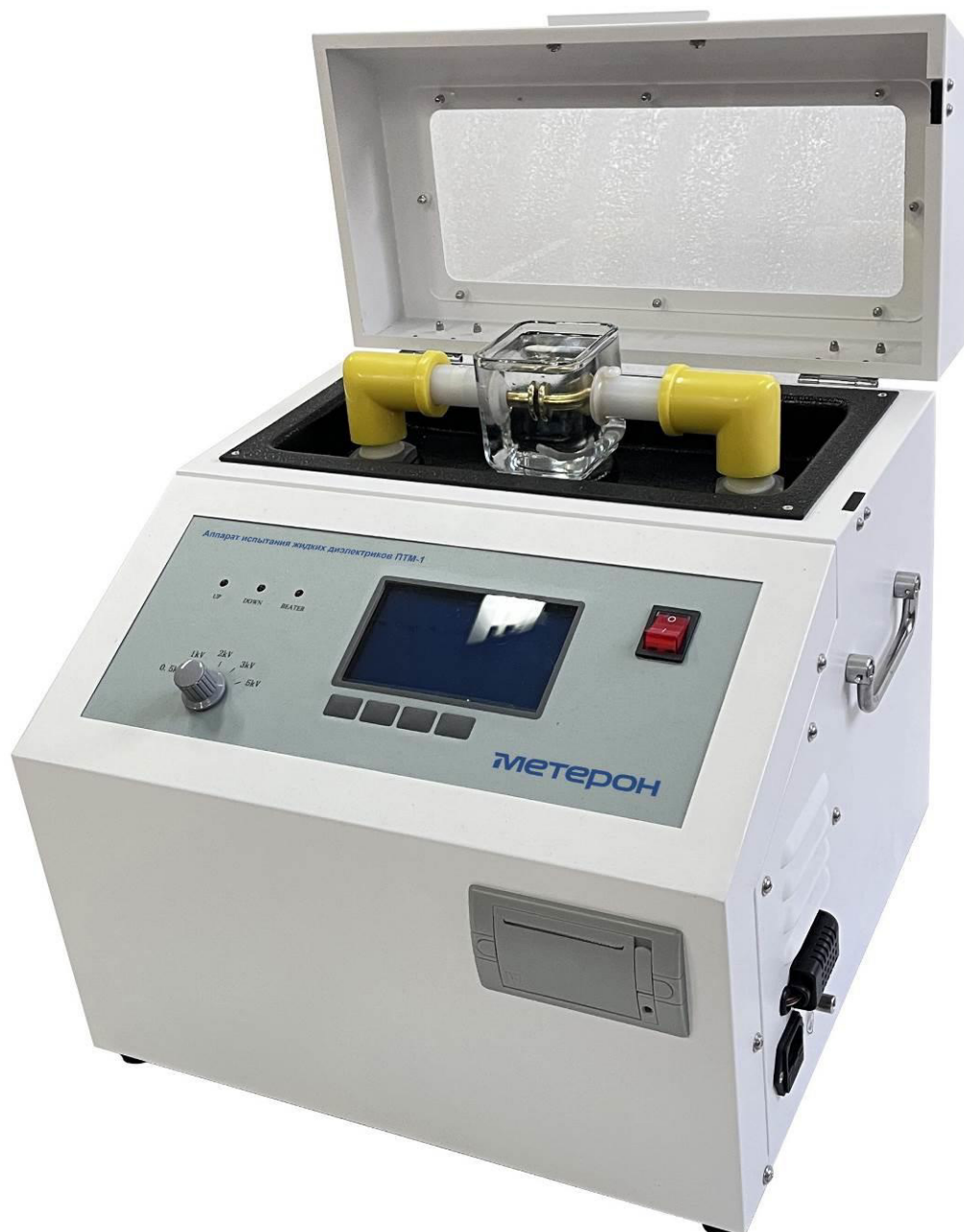
Рисунок 1 – Общий вид аппаратов испытания жидких диэлектриков Метерон ПТМ-1

Обозначение места нанесения заводских номеров представлено на рисунках 6 – 7.