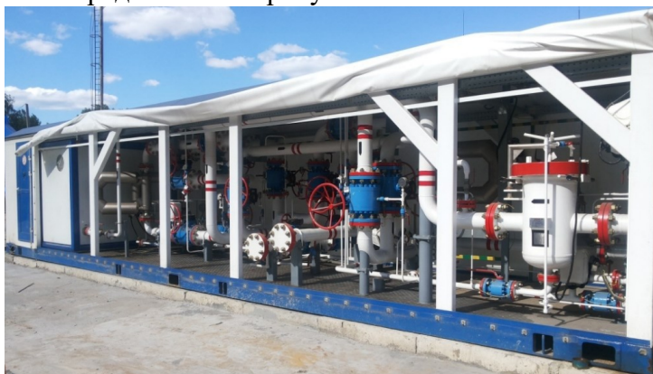
Рисунок 1 - Общий вид СИКН

Общий вид СИКН представлен на рисунке 1.