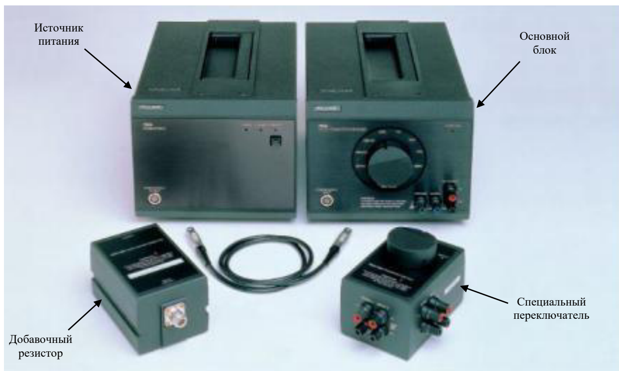
Рисунок 1 - Общий вид преобразователя Fluke 792A

Место нанесения пломбы в виде наклейки, исключающей несанкционированный доступ к внутренним элементам и точкам настройки добавочного резистора (792A-7002 1000 V RANGE RESISTOR) показано на рисунке 2. Заводской номер нанесен на маркировочную наклейку в виде цифрового кода.