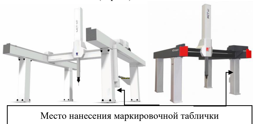
Рисунок 2 – Общий вид КИМ модификаций МСТ NT (слева) и МСТ NT Light (справа)