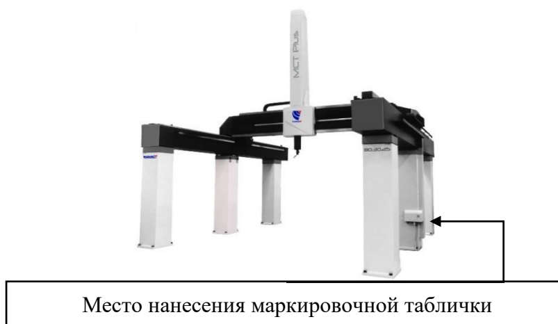
Рисунок 3 – Общий вид КИМ модификации МСТ Plus