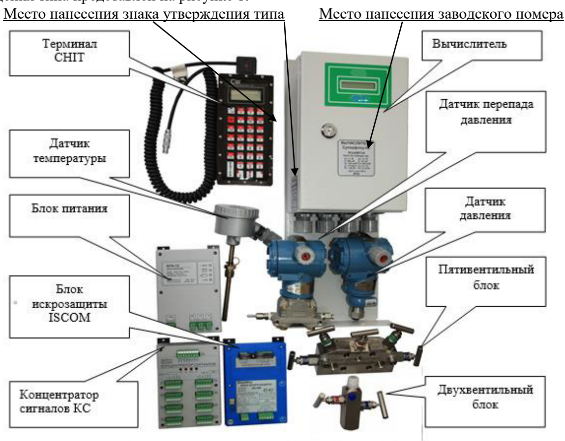
Рисунок 1 - Общий вид комплексов многониточных измерительных микропроцессорных Суперфлоу-ПЕ

Общий вид комплексов с указанием места нанесения заводского номера и знака утверждения типа представлен на рисунке 1.