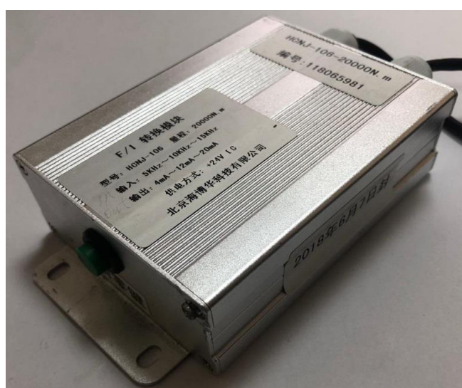
Рисунок 3 - Общий вид вторичного преобразователя