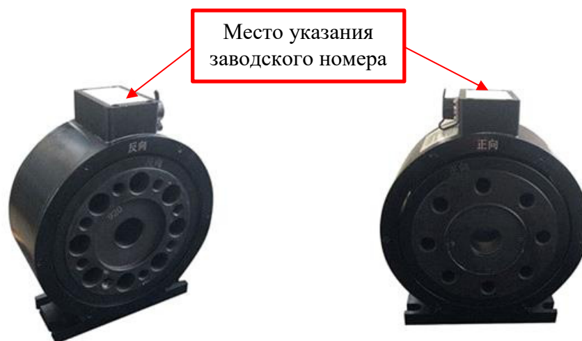
Рисунок 1 - Общий вид датчиков крутящего момента силы типа HCNJ-106