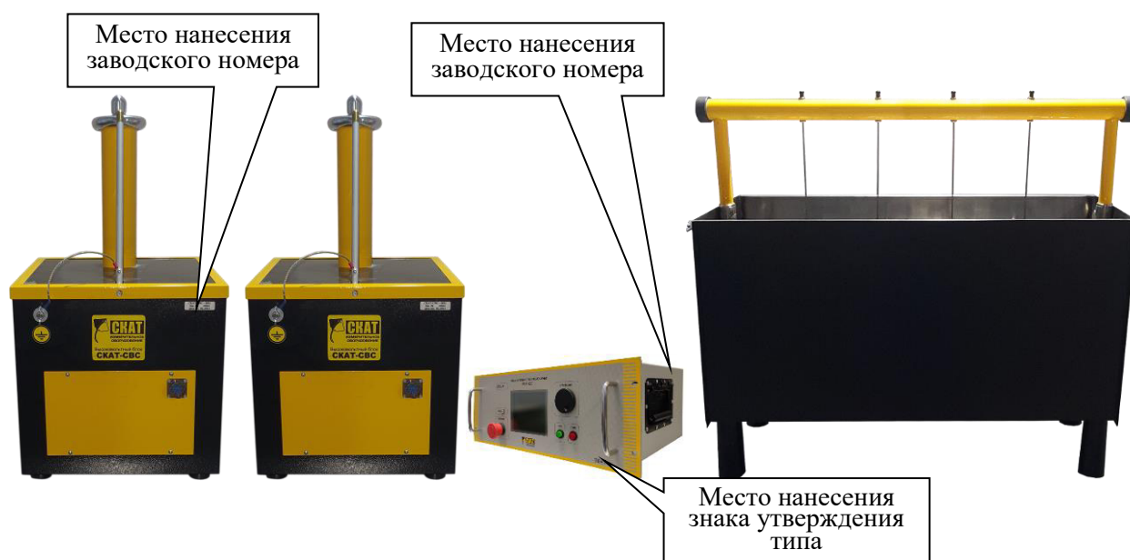
Рисунок 2 – Общий вид станда СКАТ-СВС-100Ц с указанием мест нанесения заводского номера, знака утверждения типа