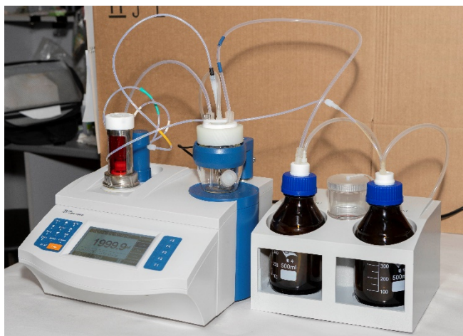
Рисунок 1 – Общий вид титратора автоматического КФТ модели КФТ-40С