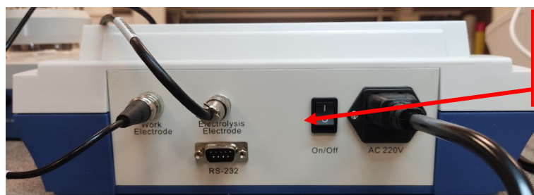
Рисунок 3 – Общий вид титратора автоматического КФТ модели КФТ-40С, вид сзади