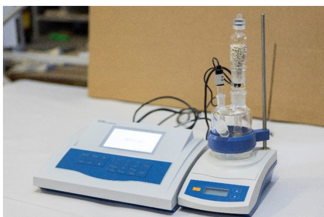
Рисунок 2 – Общий вид титратора автоматического КФТ модели КФТ-20V