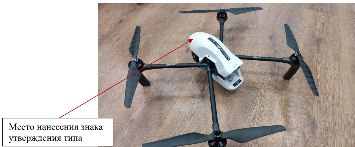
Рисунок 1 - Общий вид БВС с указанием места нанесения знака утверждения типа

Общий вид БВС с указанием места нанесения знака утверждения типа приведен на рисунке 1. Место нанесения заводского номера приведено на рисунке 2. Место пломбировки от несанкционированного доступа приведено на рисунке 3.