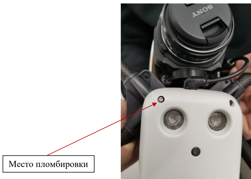
Рисунок 3 –Место пломбировки от несанкционированного доступа