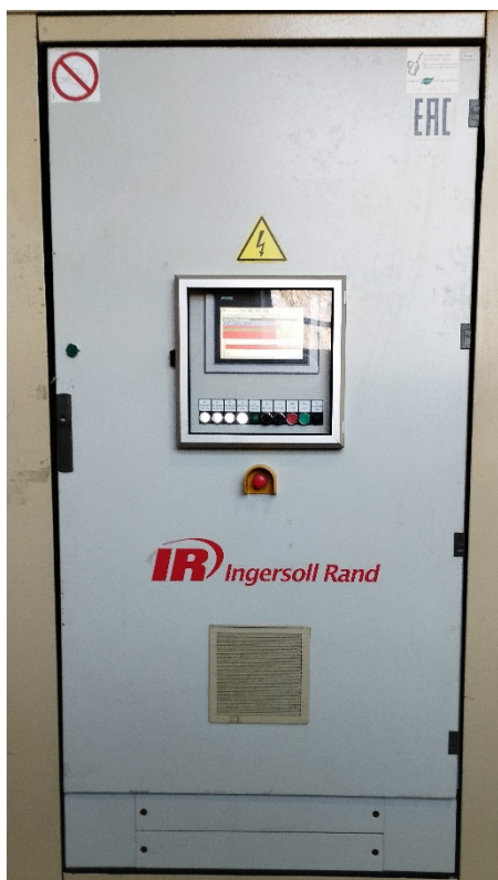
Рисунок 1 – Общий вид комплекса

Комплекс обеспечивает выполнение следующих основных функций: