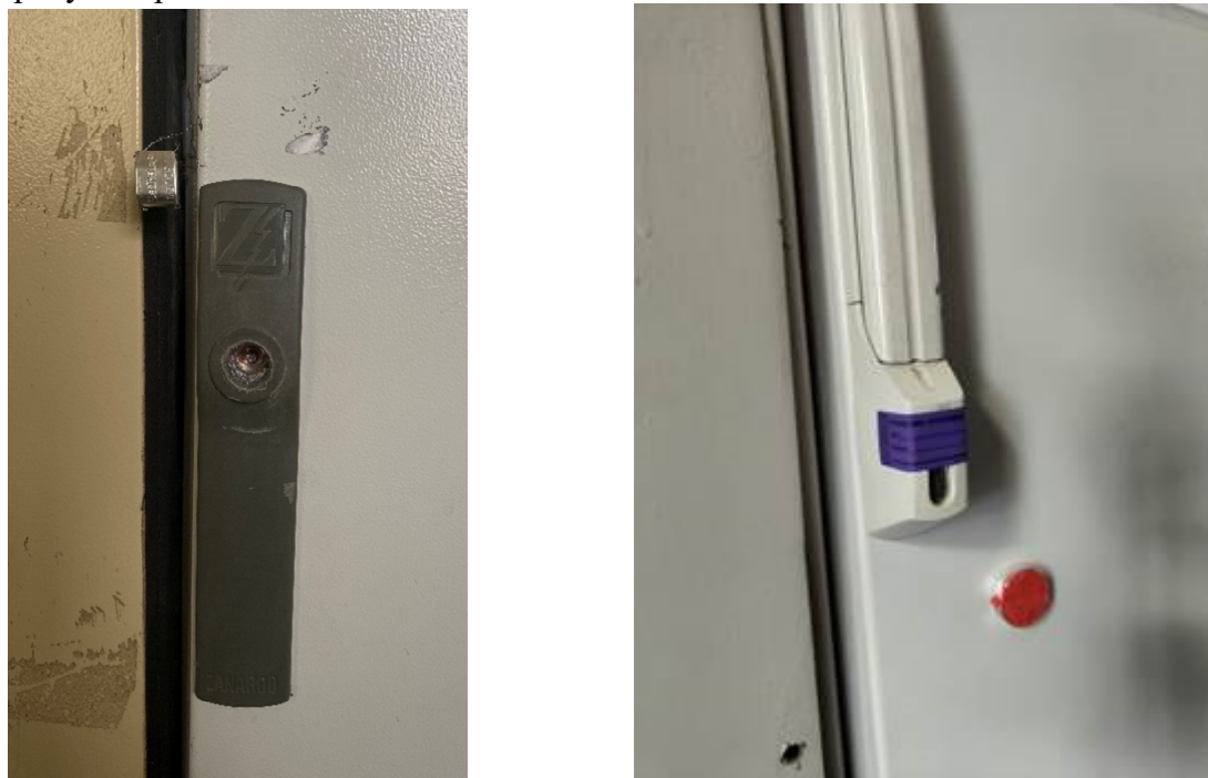
Рисунок 3 – Схема пломбировки шкафов комплекса

Пломбирование шкафов комплекса осуществляется с помощью контрольной проволоки, проведенной через специальное отверстие, и запорно-пломбировочного устройства или индикаторной ленточной пломбы в виде наклейки. Схема пломбировки шкафов комплекса от несанкционированного доступа представлена на рисунке 3. Нанесение знака поверки на комплекс не предусмотрено.