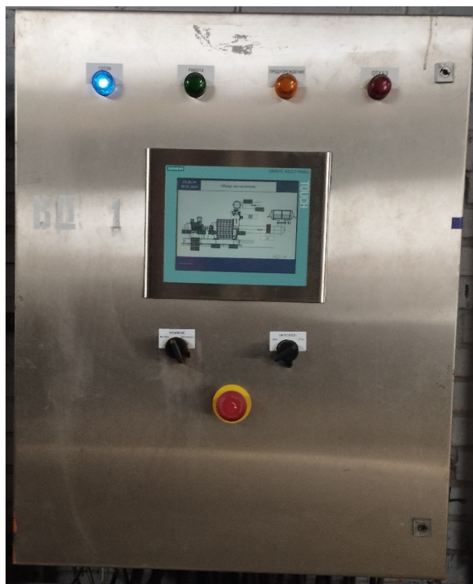
Рисунок 1 – Общий вид комплекса

Комплекс обеспечивает выполнение следующих основных функций: