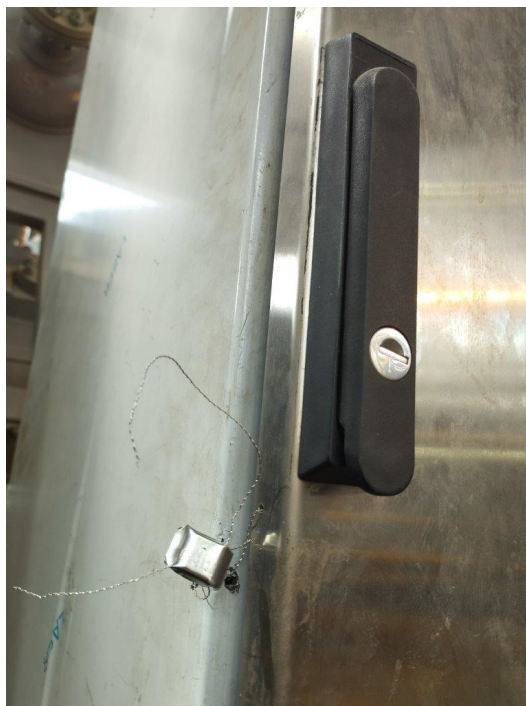
Рисунок 3 – Схема пломбировки шкафа комплекса

Пломбирование шкафа комплекса осуществляется с помощью контрольной проволоки, проведенной через специальное отверстие, и запорно-пломбировочного устройства или индикаторной ленточной пломбы в виде наклейки. Схема пломбировки шкафов комплекса от несанкционированного доступа представлена на рисунке 3. Нанесение знака поверки на комплекс не предусмотрено.