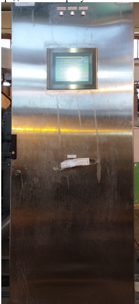
Рисунок 1 – Общий вид комплекса

Общий вид комплекса представлен на рисунке 1.