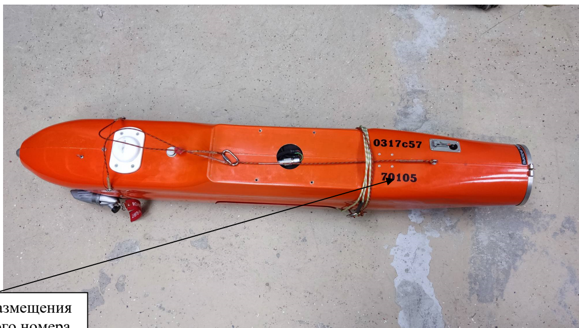
Рисунок 1 - Общий вид БВС с указанием места нанесения знака утверждения типа