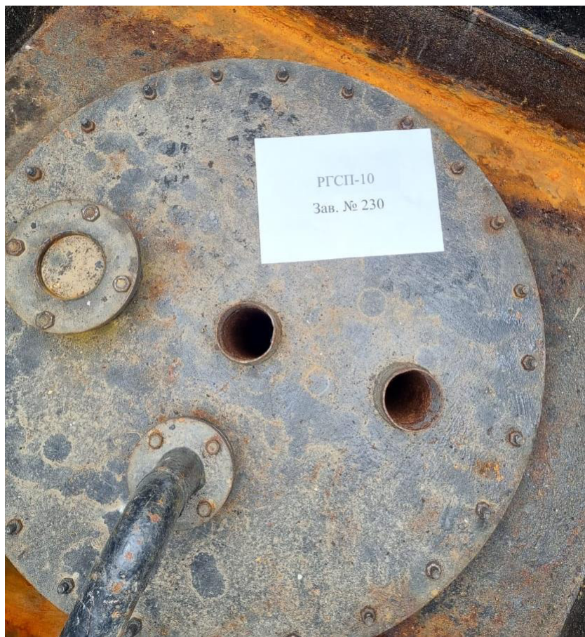
Рисунок 2 – Горловина резервуара РГСП-10

Пломбирование резервуара РГСП-10 не предусмотрено.