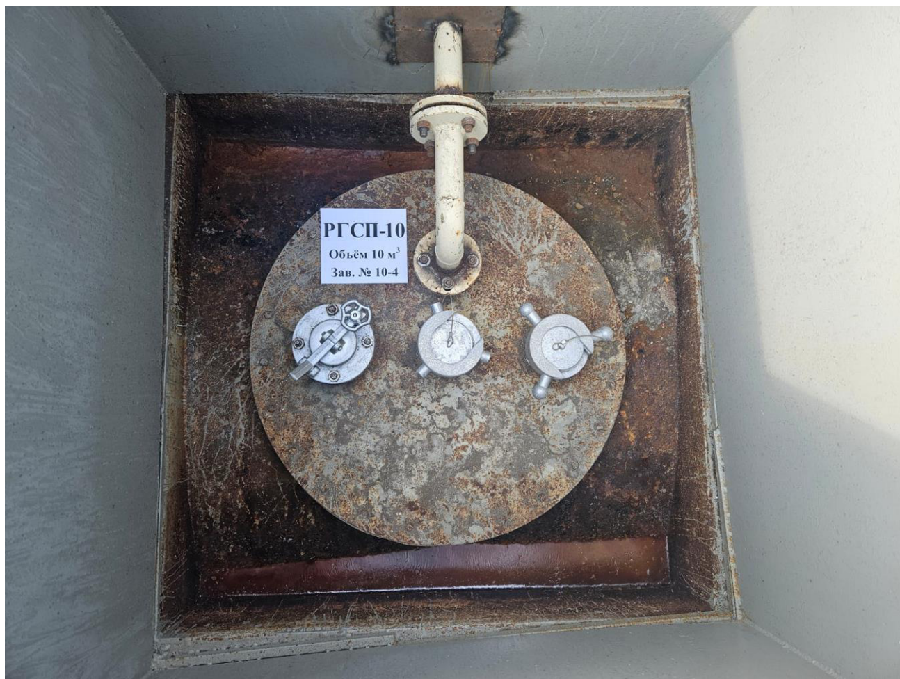
Рисунок 2 – Горловина резервуара РГСР-10

Пломбирование резервуара РГСР-10 не предусмотрено.