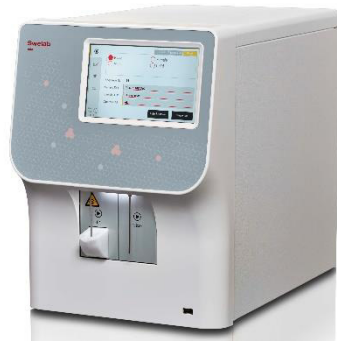
Swelab Alfa Plus Basic