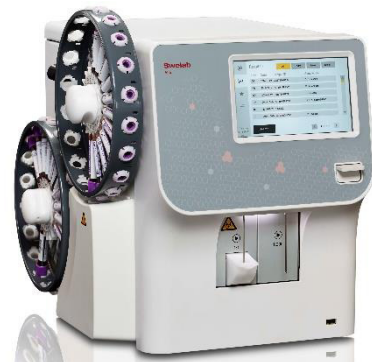
Swelab Alfa Plus Sampler BD AR