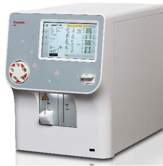
Swelab Alfa Plus Standard