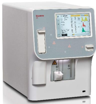
Swelab Alfa Plus Cap AR