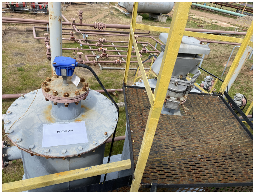
Рисунок 2 – Общий вид заливной горловины