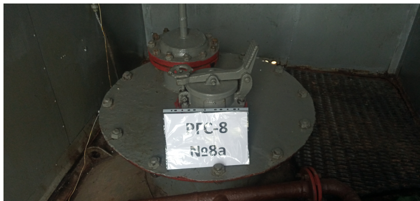
Рисунок 2 – Общий вид заливной горловины