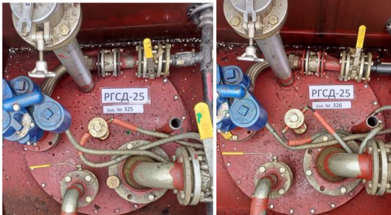
Рисунок 2 – Горловины и измерительные люки резервуаров РГСД-25 зав.№№ 325, 326