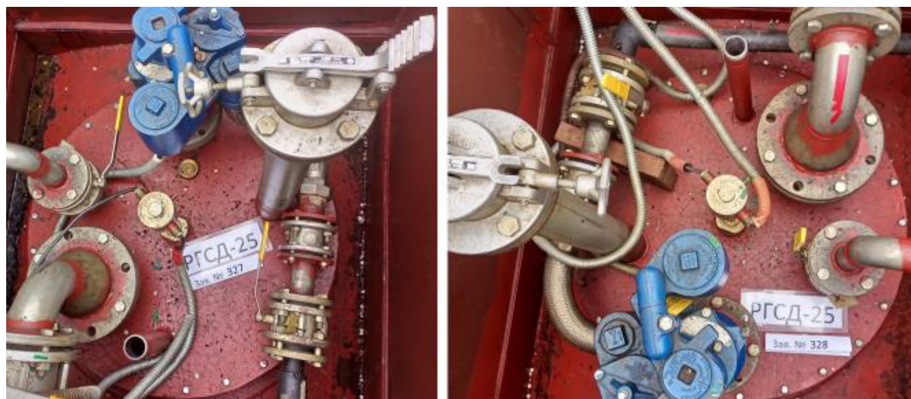
Рисунок 3 – Горловины и измерительные люки резервуаров РГСД-25 зав.№№ 327, 328