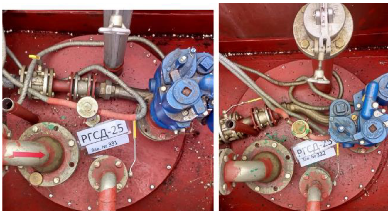
Рисунок 5 – Горловины и измерительные люки резервуаров РГСД-25 зав.№№ 331, 332 Пломбирование резервуаров РГСД-25 не предусмотрено.