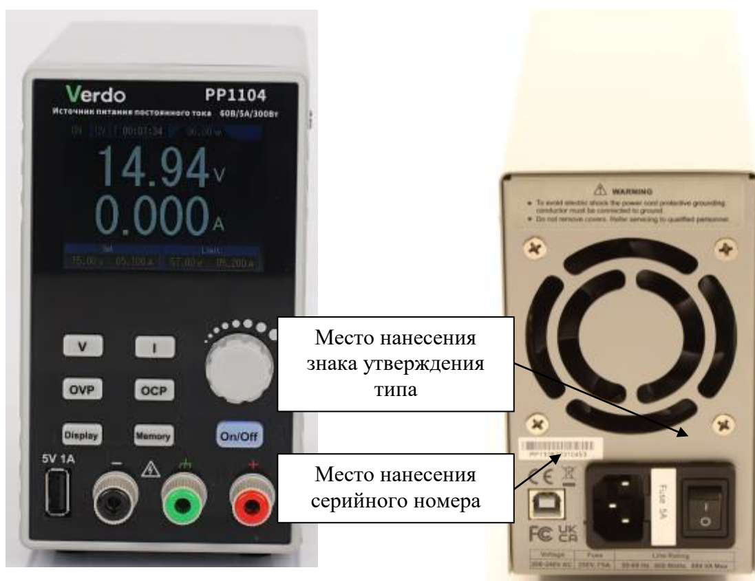
Рисунок 1 – Общий вид источников серии VERDO PP1100 с указанием места нанесения знака утверждения типа, места нанесения серийного номера

Общий вид источников серии VERDO PP1100 с указанием места нанесения знака утверждения типа, места нанесения серийного номера представлен на рисунке 1. Общий вид источников серии VERDO PP1700 с указанием места нанесения знака утверждения типа, места нанесения серийного номера представлен на рисунке 2. Нанесение знака поверки на источники не предусмотрено. Пломбирование мест настройки (регулировки) источников не предусмотрено.