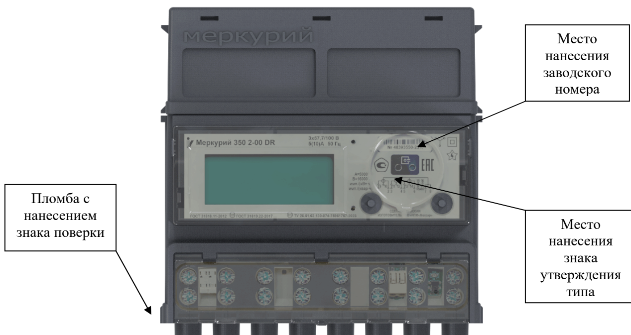
а) счетчики модификаций Меркурий 350М, Меркурий 350