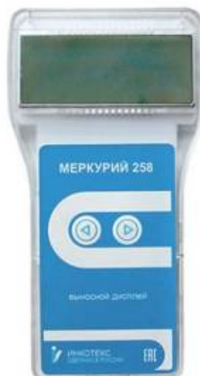
Рисунок 2 – Общий вид выносного дисплея Меркурий 258