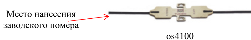
Рисунок 5 – Внешний вид брэгговских датчиков для компенсации дрейфа температуры

* Примечание: датчики os3110 и os3120 отличаются методом установки (точечная приварка и приклейка, соответственно)