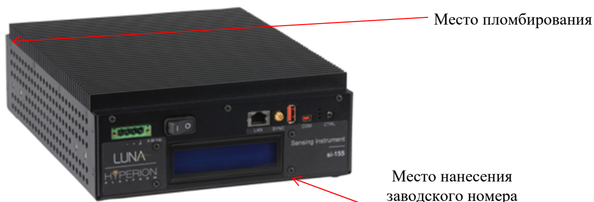
Рисунок 1 – Внешний вид измерительного устройства Si-155

Общий вид систем, схема пломбировки от несанкционированного доступа, обозначения мест нанесения маркировки представлены на рисунках 1 – 5.