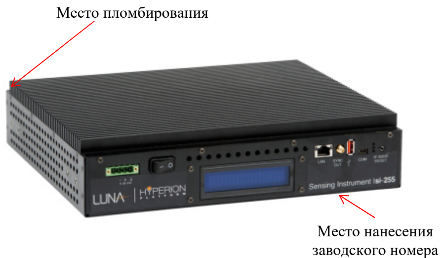
Рисунок 2 – Внешний вид измерительного устройства Si-255