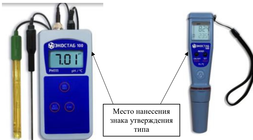
д) модификации PH111, PH112