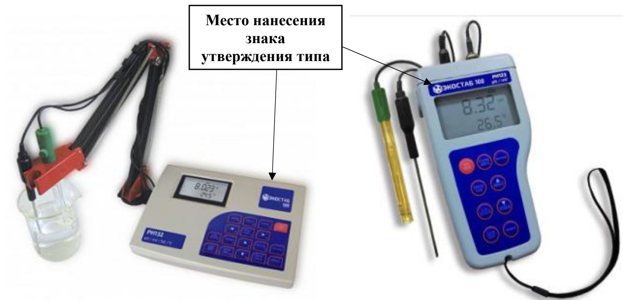
в) модификации PH131, PH132, PH133, PH134, PH135