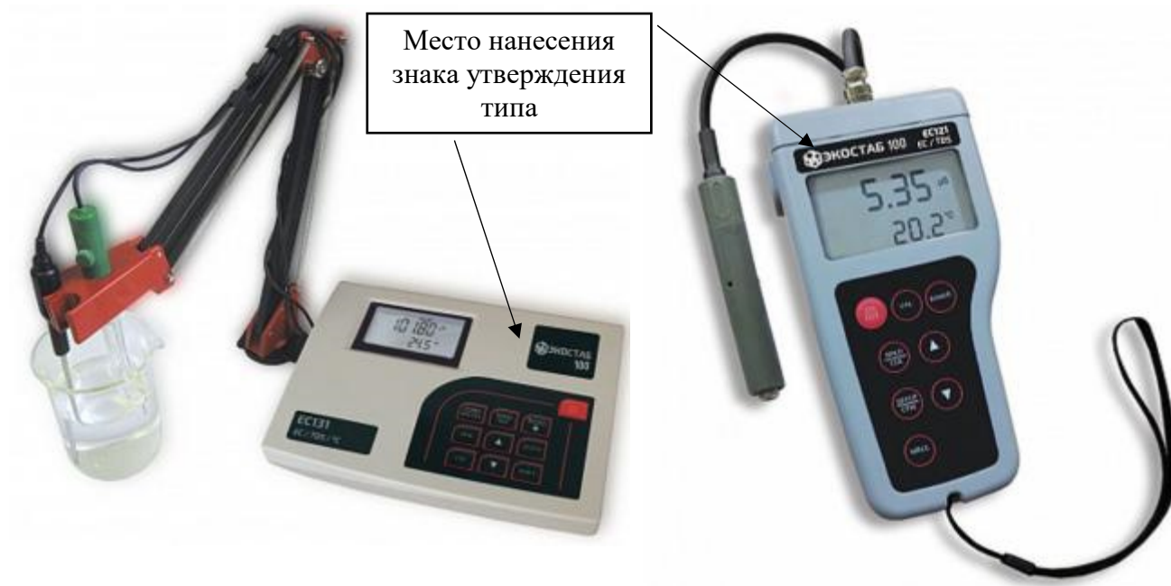
ж) модификация EC131