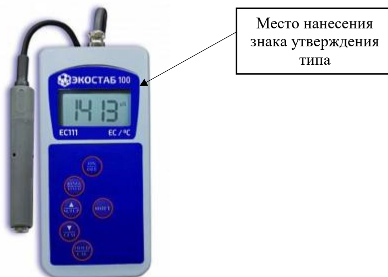
и) модификации EC111, TDS111