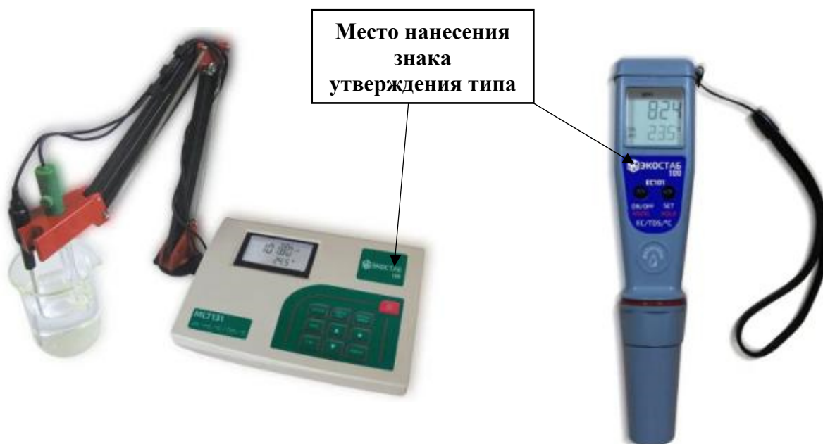
а) модификация MLT131

Пломбирование анализаторов не предусмотрено.