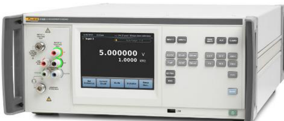
Рисунок 1 - Общий вид вольтметр переменного напряжения эталонного Fluke 5790B

Нанесение знака поверки на вольтметр переменного напряжения эталонный Fluke 5790B не предусмотрено.