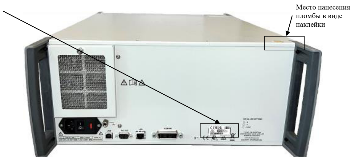
Рисунок 2 – Схема пломбировки от несанкционированного доступа, место нанесения маркировочной наклейки