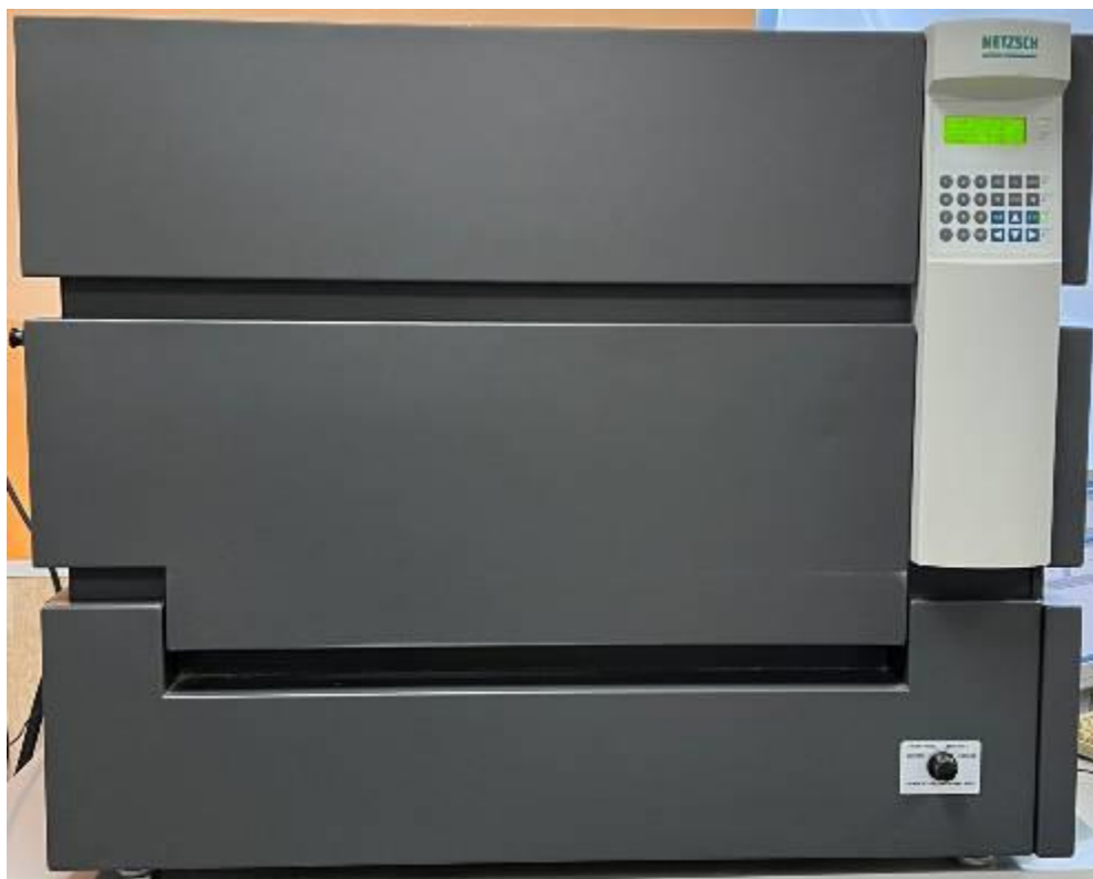
Рисунок 1 – Общий вид прибора для измерения теплопроводности HFM 436/6/1