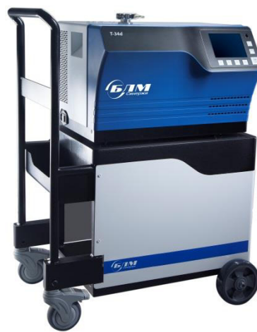
Рисунок 2 – Общий вид течеискателей модификации Т-34i, Т-34d