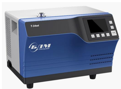
Рисунок 3 – Общий вид течеискателей модификации Т-34wt