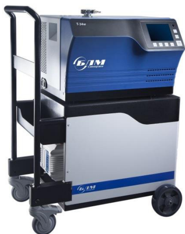
Рисунок 1 – Общий вид течеискателей модификации Т-34w

Общий вид течеискателей представлен на рисунках 1-3. Маркировочная наклейка течеискателя представлена на рисунке 4