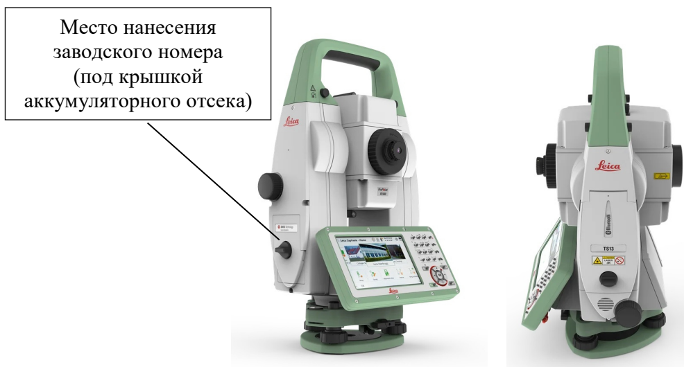
Рисунок 1 – Общий вид тахеометров электронных Leica TS13

Общий вид маркировочной наклейки с указанием места расположения заводского номера представлен на рисунке 2.