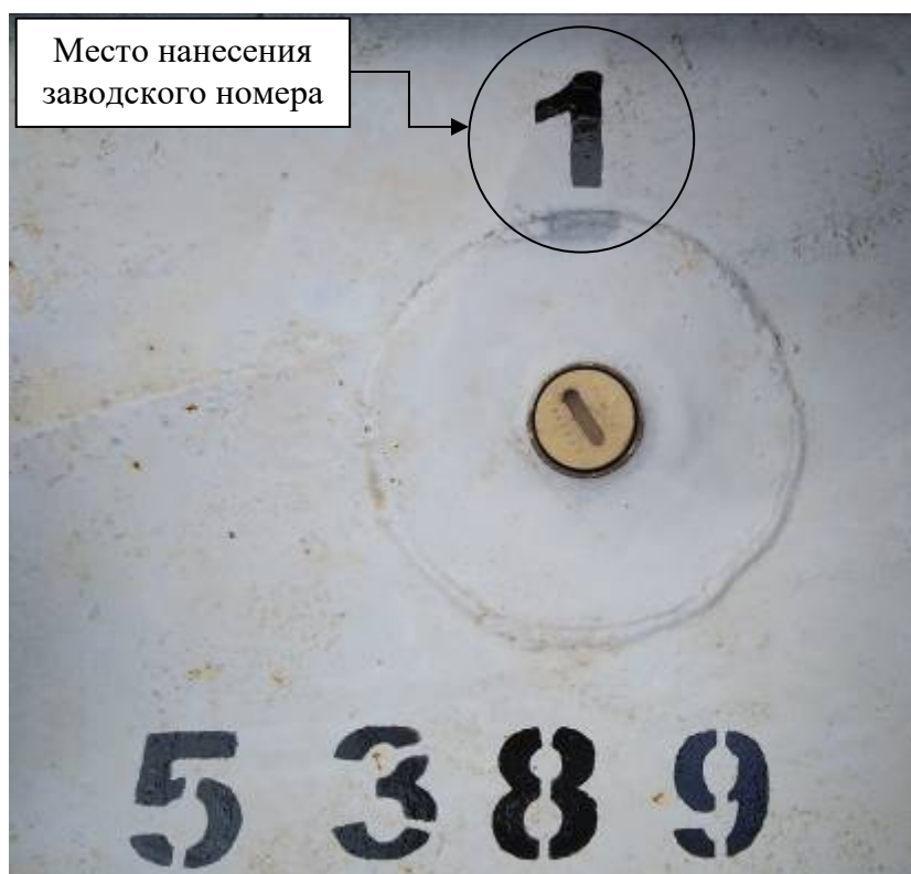
Р и с у н о к 3 – Общий вид замерного люка и места нанесения заводского номера

Заводские номера в виде цифровых обозначений, обеспечивающие идентификацию каждого экземпляра средств измерений, нанесены на стенки танков методом окраса. Общий вид замерного люка и место нанесения заводского номера представлены на рисунке 3.