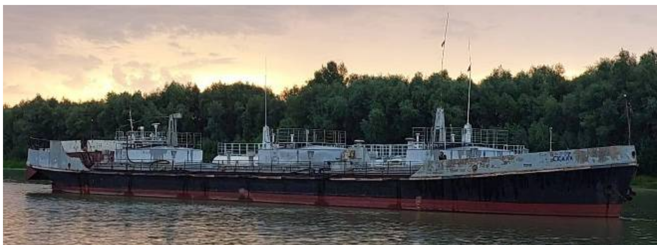
Р и с у н о к 1 – Общий вид нефтеналивной баржи «Скала»

Общий вид нефтеналивной баржи «Скала» представлен на рисунке 1.