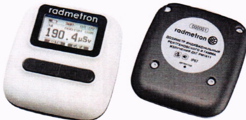
Рисунок 1.1 – Фотографии общего вида дозиметров (изображения носят иллюстративный характер)