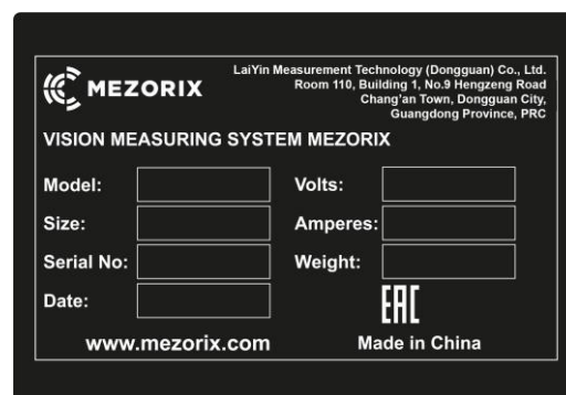
Рисунок 6 – Общий вид маркировочной таблички