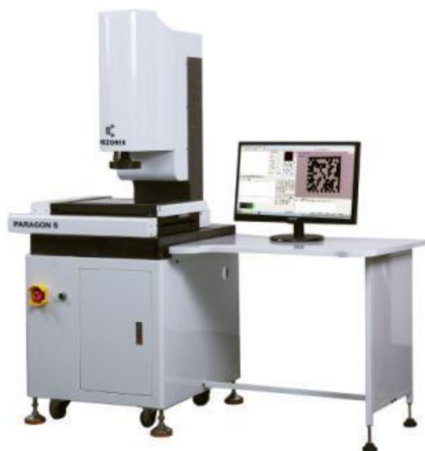
Рисунок 2 – Общий вид систем видеоизмерительных MEZORIX модификации PARAGON S