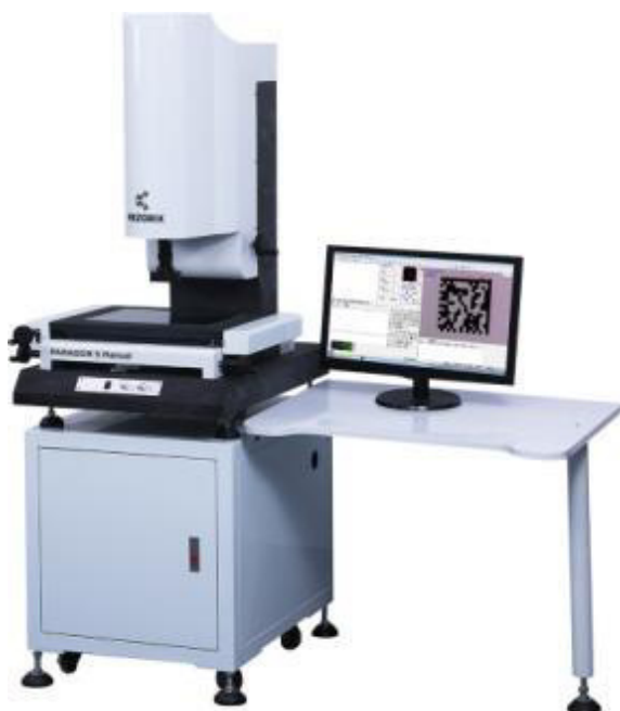
Рисунок 1 – Общий вид систем видеоизмерительных MEZORIX модификации PARAGON S Manual

Общий вид маркировочной таблички представлен на рисунке 6.