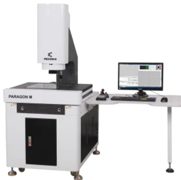
Рисунок 3 – Общий вид систем видеоизмерительных MEZORIX модификации PARAGON M