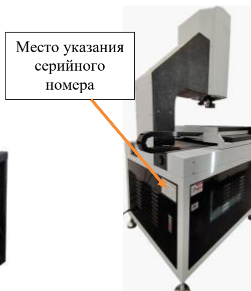
Рисунок 5 – Место указания серийного номера