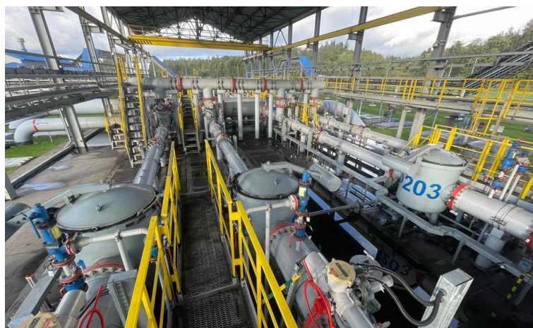
Рисунок 1 - Общий вид СИКН

Особенностью конструкции СИКН является использование резервного БИЛ, контрольно-резервной ИЛ и блока ТПУ для работы с СИКН, расположенных на территории нефтебазы «Усть - Луга».